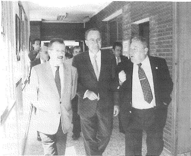
Inicio de los actos. Delegado de Educación, Alcalde la de ciudad y Director del Centro