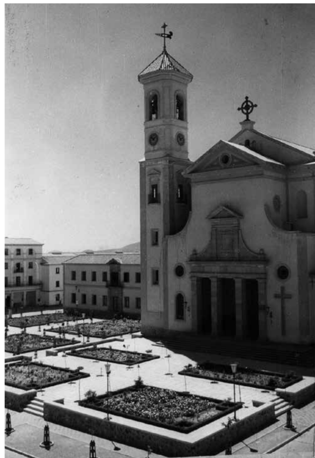
Plaza de Pio XII en la barriada de Carranque con la iglesia de San José Obrero