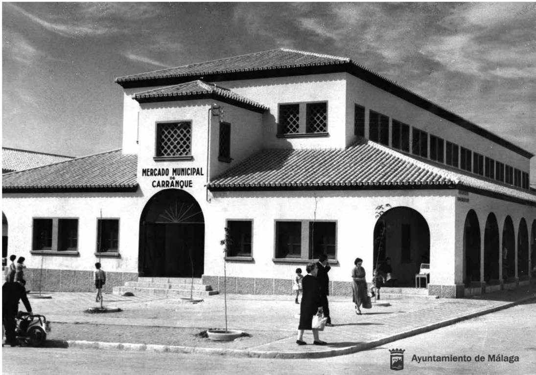
Mercado Municipal de Carranque