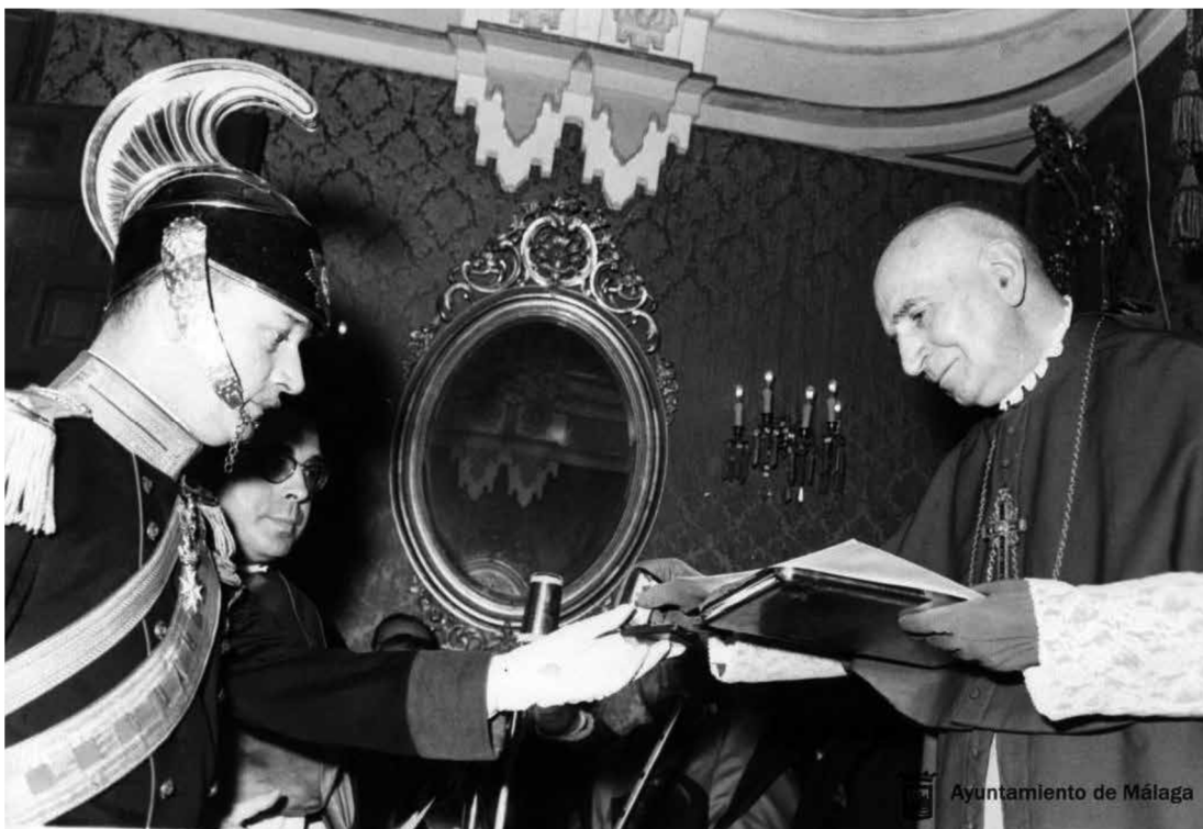
El príncipe Alejandro del Drago, capitán de la Guardia Noble de Su Santidad, entrega a Herrera Oria el nombramiento y el solideo de cardenal en el Palacio Episcopal de Málaga