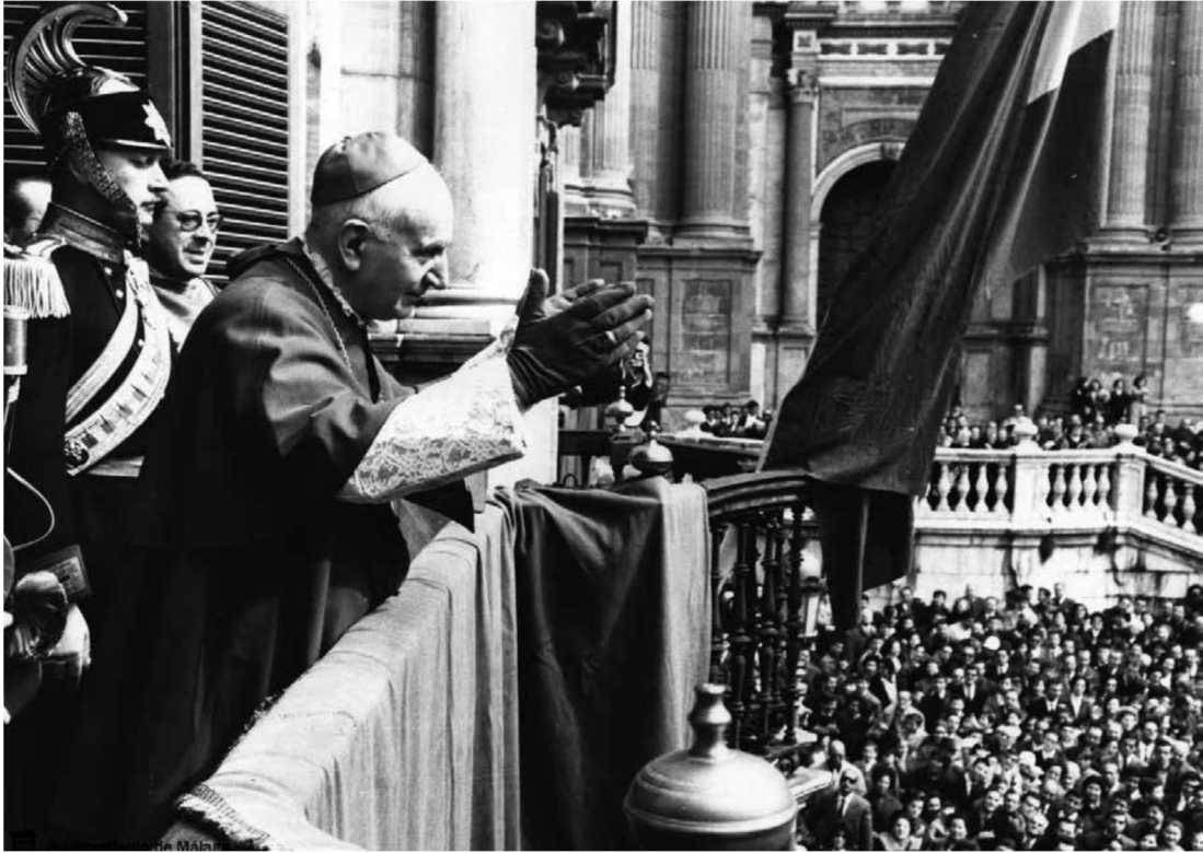
El Cardenal Herrera Oria saludando desde el balcón del palacio episcopal tras ser nombrado cardenal